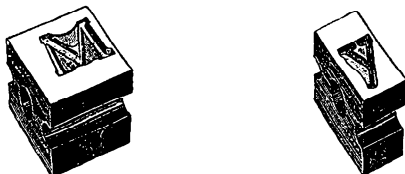
MATRICES .4'' \times .4'' ET .4 \times .2 POUR COMPOSITION GROS CORPS

Caractères très larges. — Les caractères plus larges que le maximum de valeur d'unités d'une rangée du châssis à matrices sont parfois fondus en composition avec une partie débordante. Cette partie débordante est supportée par un blanc haut qui est